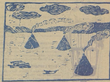
«Утро в тундре». Рисунок Аристарха.

Это мой дом. Моя родина. А. ЛЕЛЬБЕР. Ненецкий национальный округ.