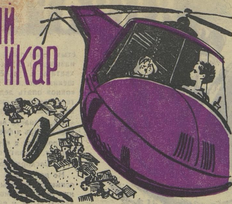
Рис. Е. МЕДВЕДЕВА.

II Эге-ге, пещерный житель, как тебе удалось превратиться в птицу? Страх, радость, смияние, восторг — всё перемешалось в нём. И эта весёлая смесь поднимала его выше, а потом бросала вниз. Неожиданно вилку закатили подоса близка с маленькими фигурками загорюпочих, с кружками зонтов. Крохотные мальчишки бежали за тенью вертолёта. И ни одному из них не приходило в голову, что этот грохочущий воздушный корабль ведёт не настоящий пилот, а спешерный житель Микоса, который может любому из них съездить в ухо и от любого получить сдачи. На всякий случай Микоса погрозил им кулаком.